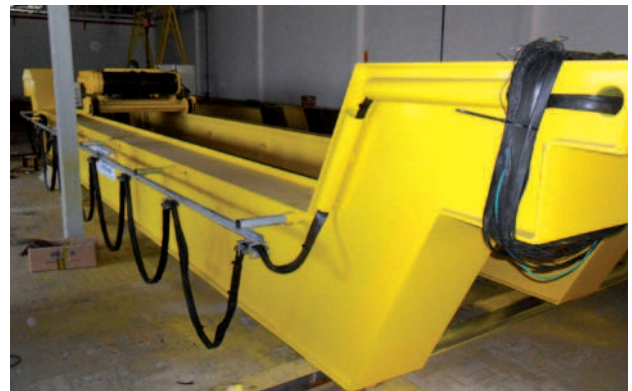
Alteração de vão em ponte rolante 10t