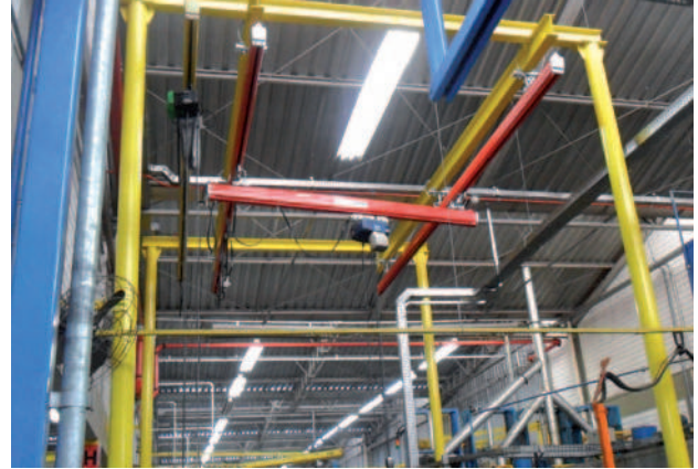
Estrutura com sistema modular para capacidades até 2t com arraste manual