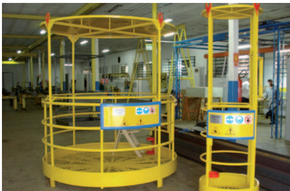
Balancins de manutenção